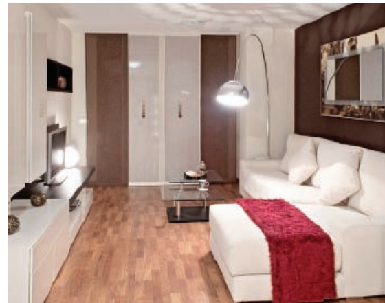
EXEMPLE DE FOTOGRAFIA D' UN FOTOGRÀF

2. CEIGRUP FINQUES COMPANYY es fa càrrec del Certificat d'Eficiència Energètica. Aquest es tramitarà una vegada es signi el contracte de compravenda amb CEIGRUP FINQUES COMPANYY