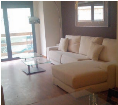
EXEMPLE DE FOTOGRAFIA DEL CLIENT

1. Elaborem un ampli reportatge fotogràfic i un vídeo personalitzat, si s'escau, a determinats immobles el qual es publica i promociona a la web, a internet (YouTube), a diferents xarxes socials (Facebook i Twitter), i a portals immobiliaris.